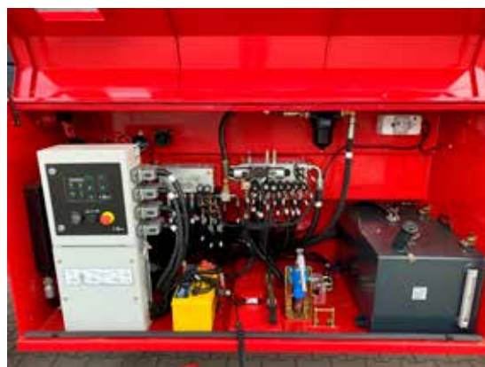
Diagnosesysteem aan boord